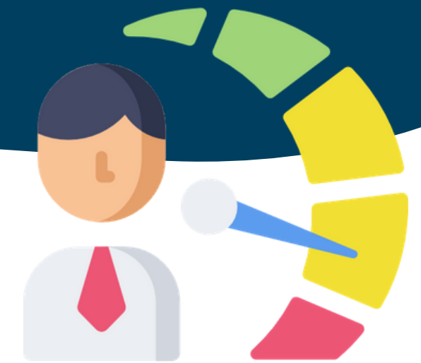
Comitato di garanzia locale